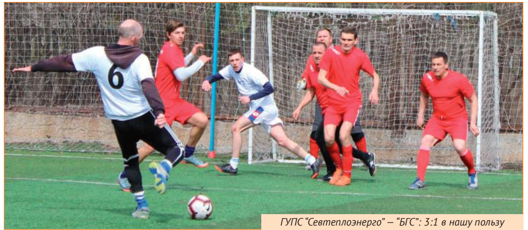
ГУПС «Севтеплоэнерго» – «БГС»: 3:1 в нашу пользу