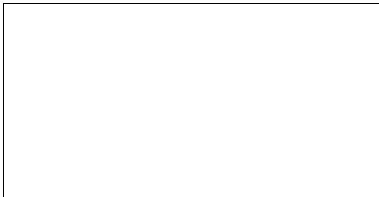
Схема границы балансовой принадлежности тепловых сетей

Прочие сведения по установлению границ раздела балансовой принадлежности тепловых сетей _____