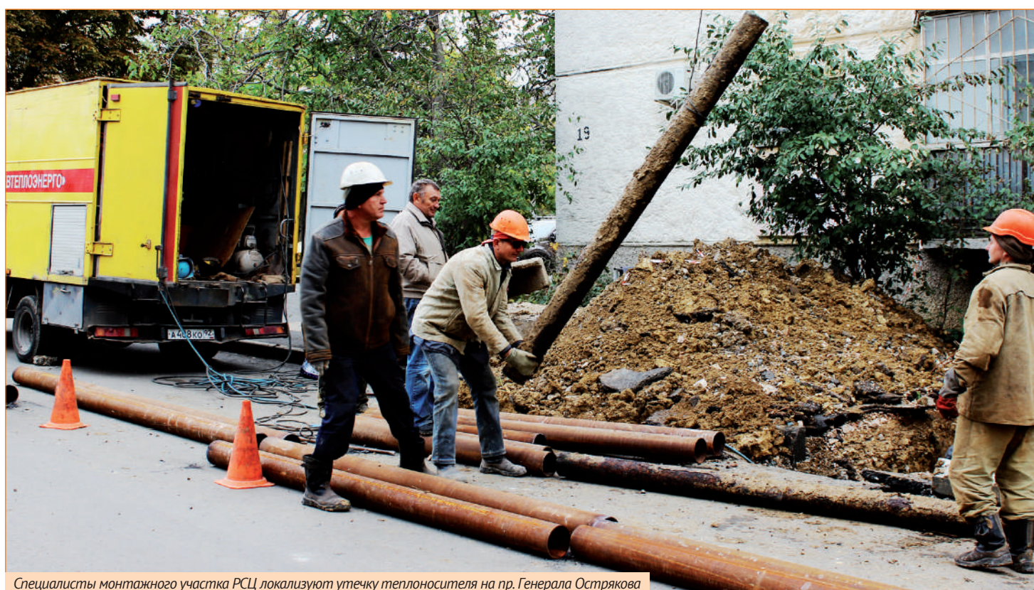
Специалисты монтажного участка РСЦ локализируют утечку теплоносителя на пр. Генерала Острякова

16 октября в соответствии с постановлением правительства Севастополя в Севастополе начался отопительный сезон. Пока на улице еще относительно тепло, но скоро наступят зимние холода, которые и дадут объективную и беспристрастную оценку большой и сложной работе, которую провели работники ГУПС «Севтеплоэнерго» по подготовке объектов теплоснабжения к отопительному сезону 2017-2018 гг.